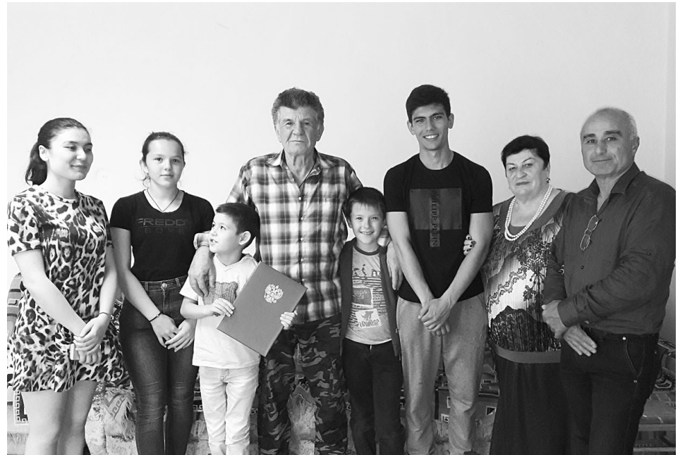
Юбиляр (в центре) с гостями и внуками.

Когда-то один из моих коллег-журналистов выразился в таком духе: приятнее писать поздравления с юбилеем, чем некрологи. Правильность этих слов не вызывает сомнения.