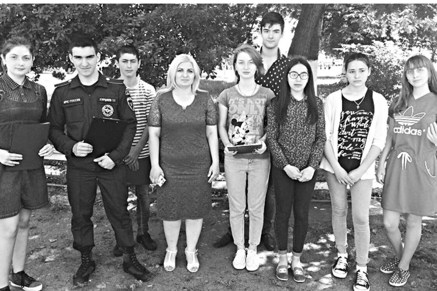
Участники и организаторы Пушкинских дней в ЭМК.

Дни великого русского поэта Александра Сергеевича Пушкина прошли в Эльхотовском многопрофильном колледже.