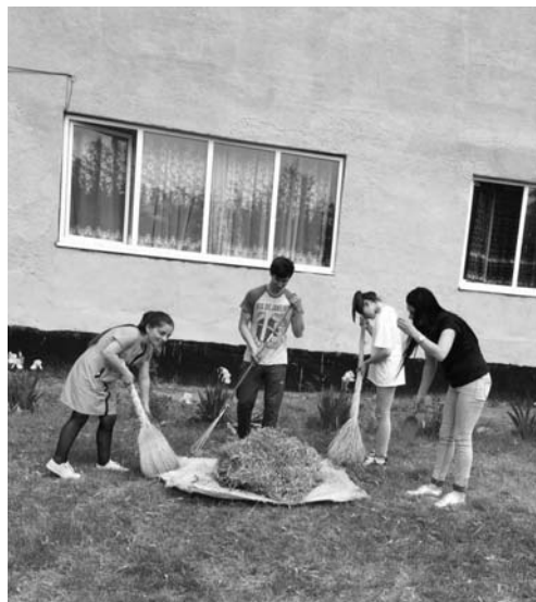
Благоустраивается двор колледжа.