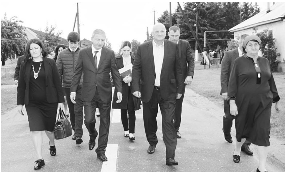
Встреча в селении Ставд-Дурта.